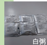
こちらは配布例です