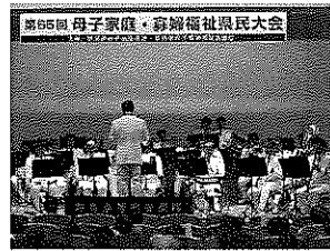
母子家庭・寡婦県民大会