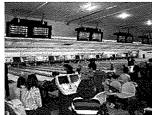
親子ボウリング大会