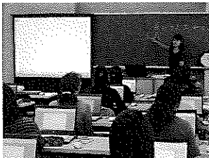
就業支援パソコン教室